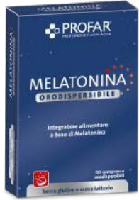
MELATONINA ORODISPERSIBILE 60 compresse

CONTINUANO LE PROMOZIONI DI APRILE VALIDE FINO AL 31 MAGGIO 2024