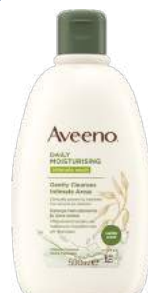
AVEENO DETERGENTE INTIMO 500 ml