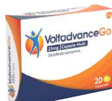
VOLTADVANCEGO 25 mg 20 capsule molli