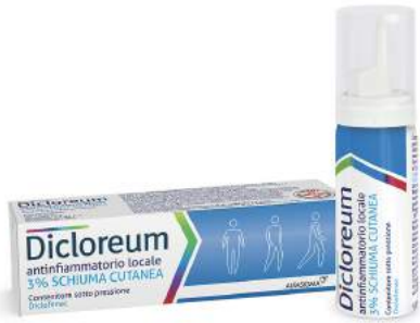
DICLOREM ANTINFIAMMATORIO LOCALE 3% schiuma cutanea 50 g