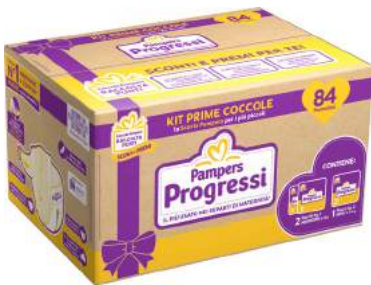
PAMPERS KIT PRIME COCCOLE 2 pacchi Progressi NEWBORN tg. 1 + 1 pacco Progressi MINI tg. 2 - 84 pannolini