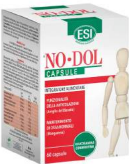
NO-DOL 60 capsule