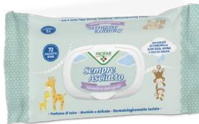
SEMPRE ASCIUTTO 72 salviette detergenti