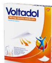
VOLTADOL 140 mg 10 cerotti medicati