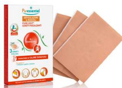
PURESENTIEL ARTICOLAZIONI & MUSCOLI PURE HEAT 3 cerotti riscaldanti