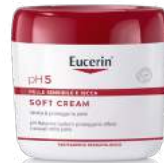
EUCERIN pH 5 Soft cream 450 ml