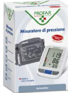
MISURATORE DI PRESSIONE