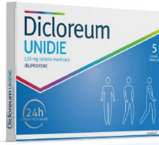
DICLOREM UNIDIE 136 mg 5 cerotti medicati