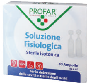
SOLUZIONE FISIOLÓGICA ISOTONICA 20 ampolle da 2 ml