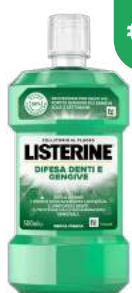
LISTERINE DIFESA DENTI E GENGIVE Collutorio 500 ml