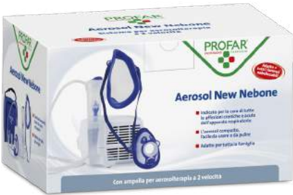
AEROSOL New Nebone