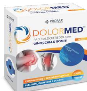
DOLORMED Pad caldo/freddo per ginocchia e gomiti