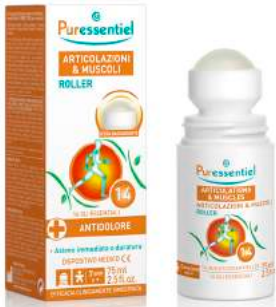
PURESENTIEL ARTICOLAZIONI & MUSCOLI ROLLER 75 ml