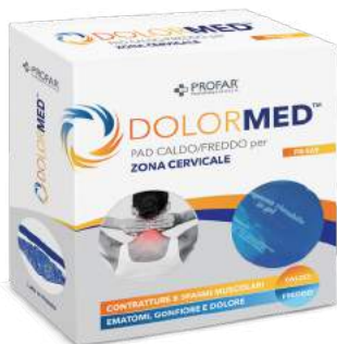
DOLORMED Pad caldo/freddo per zona cervicale