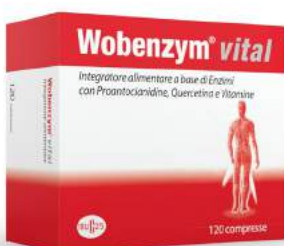
WOBENZYM VITAL 120 compresse