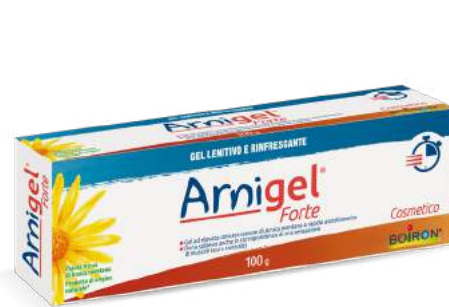
ARNIGEL FORTE GEL LENITIVO E RINFRESCANTE 100 g